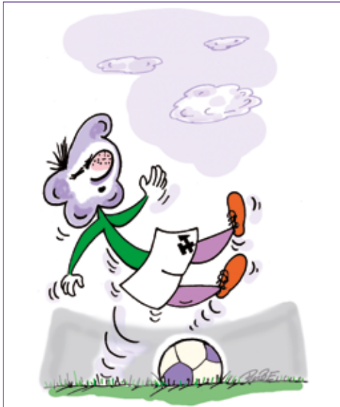
„Ein Ausrutscher im Spiel? Kann passieren. Doch danach gilt erst recht: Auf geht's Aue, kämpfen und siegen!" So fordert es das Veilchen. Zeichnung: Stephan Buße, Aue