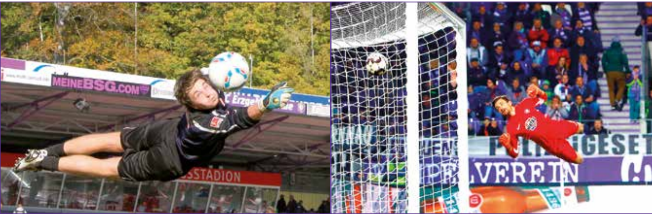
Spektakuläre Parade im Ostderby gegen den 1. FC Union Berlin am 23. Oktober 2011 (1:1). Rechts macht sich Martin wieder gaaaaanz lang und hat Glück. Im Spiel gegen die Dresdner Dynamos am 1. April 2019 streicht der Ball knapp am Kasten vorbei.