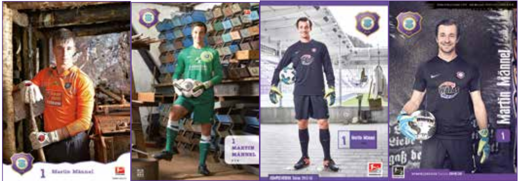
Autogramkarten aus den Zweitliga-Spieljahren 2011/12, 2013/14, 2017/18 und 2019/20.