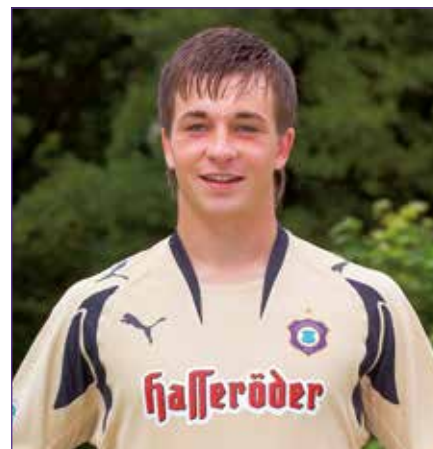
Foto von der Autogrammkarte aus der ersten Saison 2008/09.