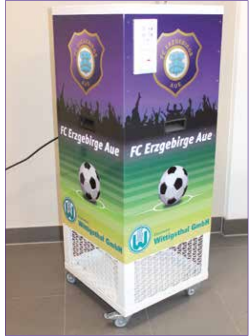
Erst im Herbst 2020 im Eisenwerk Wittigsthal entwickelt, wird der Raumlüftreiniger dort seit diesem Jahr produziert, ab März auch in Serie.

Ursprung des Betriebes ist ein 1651 im heutigen Ortsteil Wittigsthal gebautes Hammerwerk. Im 20. Jahrhundert war die Marke vor allem für Küchenherde deutschlandweit geschätzt, in der DDR dann auch für Badeöfen. Von Letzteren wurden zwischen 1975 und 1992 über vier Millionen Stück gefertigt. Heute ist das Eisenwerk bundesweit letzter Hersteller dieser Badeöfen, die im Freizeitbereich beliebt bleiben. Dies ist freilich nur noch eine Nische. Die 76 Mitarbeiter, darunter fünf Azubis beziehungsweise BA-Studenten, beschäftigen sich mit umfassenden Systemlösungen für die Lüftungs-, Heizungs- und Sanitärtechnik. Bei Fußbodenheizungsverteilern oder Kästen für Kalt- und Heißwasserzählerzählen die Erzgebirger zum Beispiel zu den Marktführern in Deutschland.