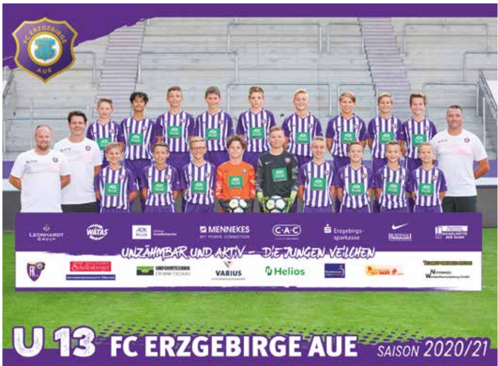
Aufnahmen: Foto-Atelier LORENZ, Zschornlau (2)