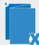
Leporello- oder Zickzackfalz (Verarbeitung nicht möglich)